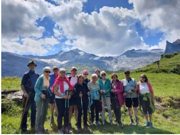
Die flotten Senioren-Wanderer auf dem Weg vom Sommerberg zur Bichlalm