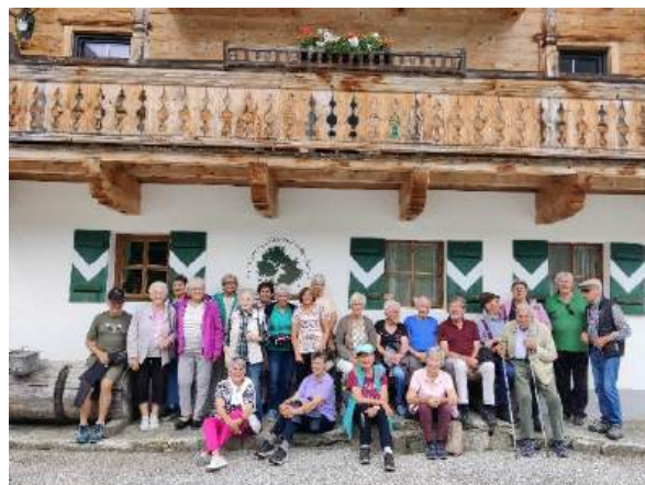
Gut aufgelegte Wandergruppe in der „Finkau“ im Wildgerlostal