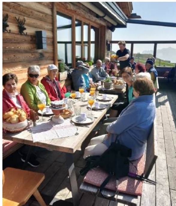
Tuxer und Finkenger Senioren beim Frühstück auf der Granatalm