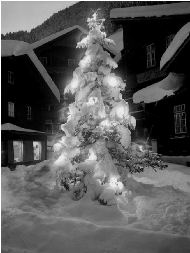
Christbaum am Dorplatz in Lanersbach