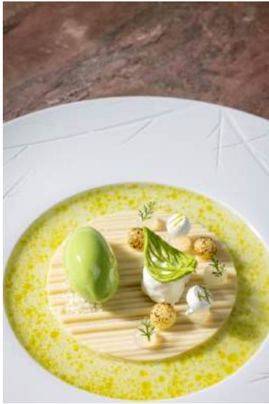
Feine Création am Teller

Die Region Tux freut sich über die Auszeichnungen und die herausragenden Leistungen der heimischen Betriebe. Sie sind ein starkes Zeichen für die hohe Qualität und Leidenschaft, mit der in Tux gekocht und bewirtet wird – mit Herz, Kreativität und viel Liebe zum Produkt.