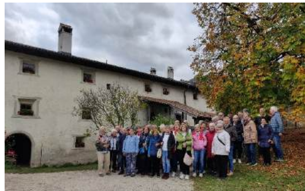
Unsere Törggela-Gruppe vor dem „Unterfinserhof“ in Lajen.