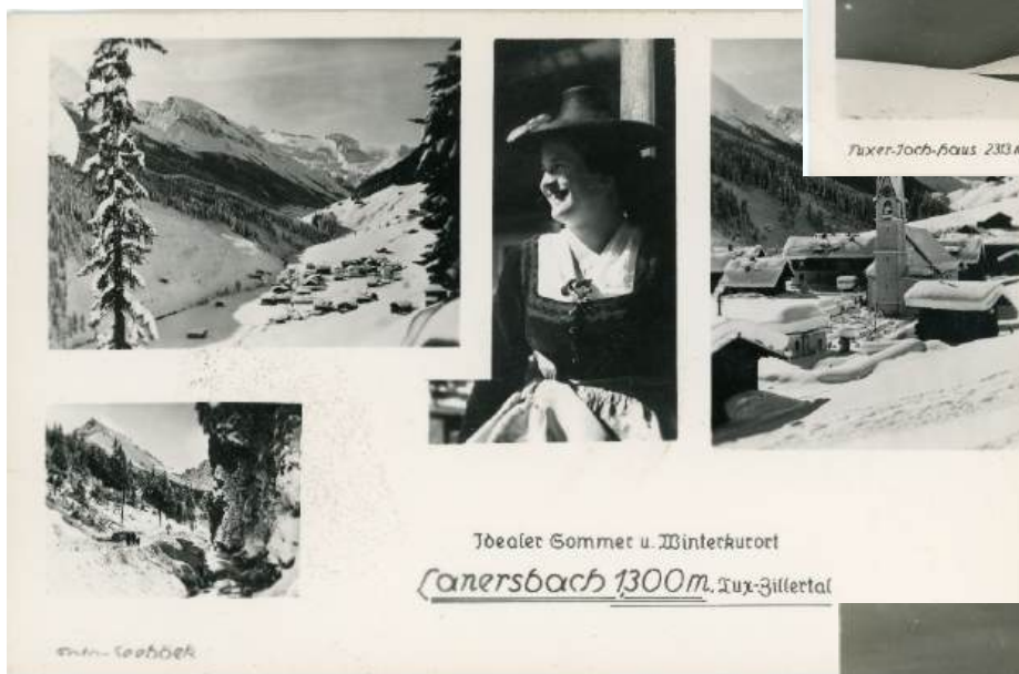
Ansichtskarte Lanersbach – – re. Blick vom Tuxerjoch Richtung Gefrorene Wand Spitze