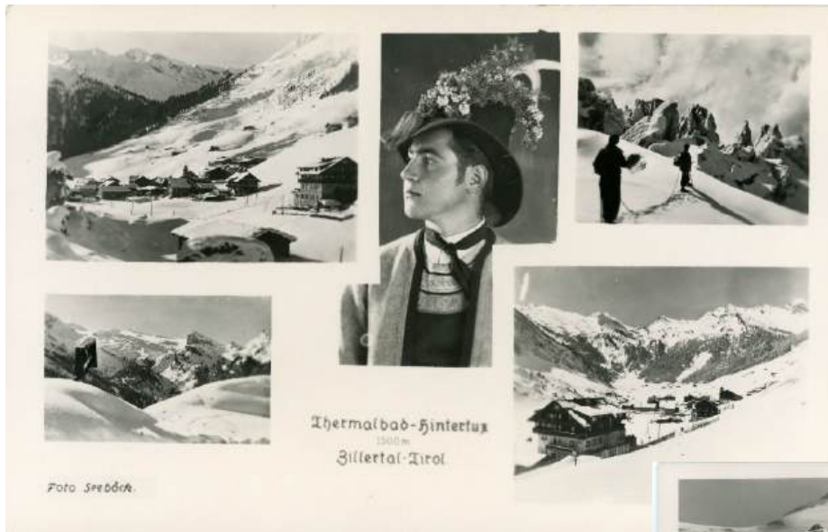
Ansichtskarte Thermalbad Hintertux – – re. Blick vom Tuxerjoch Richtung Olperer